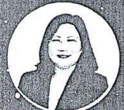
จ.เจริญพร เลิศกิจคุณภมภ์ ซีพี เมดิคอล เซนต์เตอร์ จำกัด CPMC